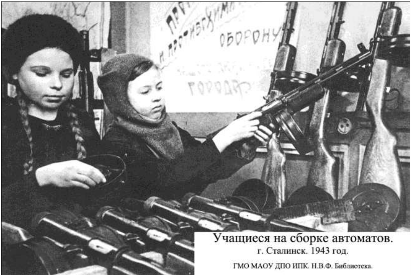
Учащиеся на сборке автоматов. г. Сталинск. 1943 год.